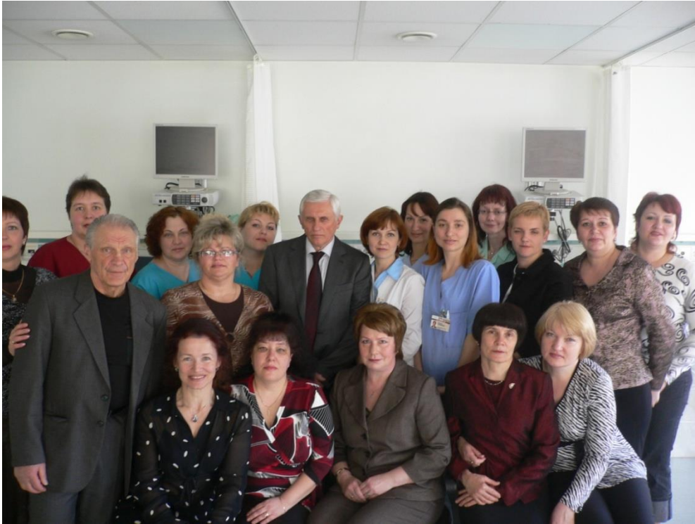
Ar Anestēzijas un intensīvās terapijas nodaļas kolektīvu. 2005. gads.