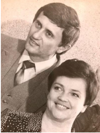
Ar dzīvesbiedri, mums jau 45 gadi. 1985. gads.