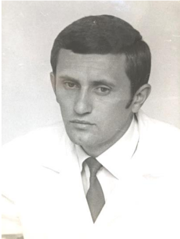
Pēc disertācijas aizstāvēšanas 1974. gadā.